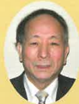
運営委員会委員長

令和6年3月に授与式を行います。また、その際に助成対象となる研究の概要について発表していただきます。